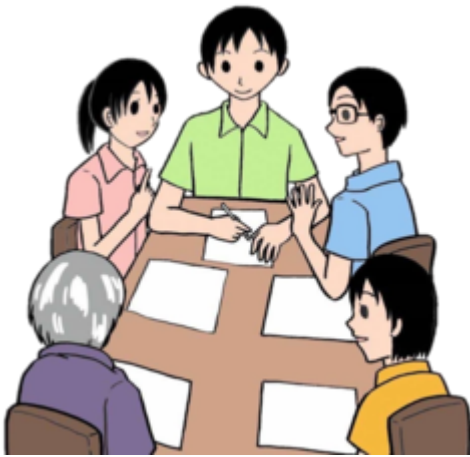
地域の合意のもと

所有者のいない猫を地域の合意のもと、地域住民が主体となって、避妊・去勢手術を施し、一定のルールに基づく餌やり、糞尿の処理、周辺の清掃などの管理を行うことにより、一代限りの命を全うさせ、猫による被害や産まれてくる不幸な子猫の数を減らし、人と動物が共生できる地域にしていく活動です。