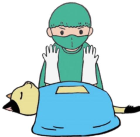
避妊去勢手術を行い