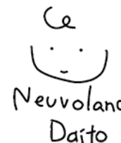
ネウボランドだいとう