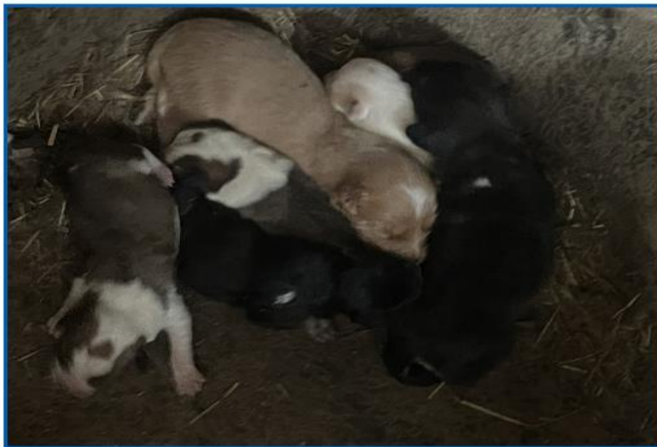
生まれた子犬が牛に踏まれて亡くなることもあったそうです

高齢となった飼い主が飼育困難を理由に地元ボランティア団体に救済を求めたことで事態は急変。どうぶつ基金へSOSが届いたとしています。