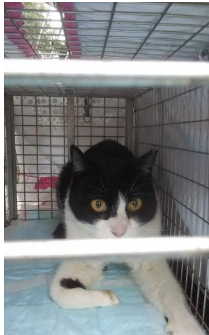
不妊去勢手術後(耳先がV字カットされています)