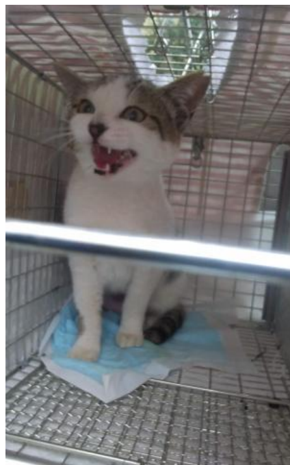
不妊去勢手術後(耳先がV字カットされています)