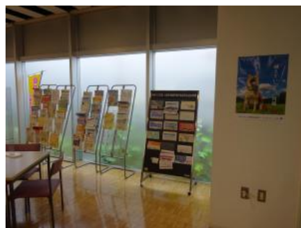
保健所1階にて掲示

10月 東京2020組織委員会主催「PEACE ORIZURU (ピース折り鶴)」への参加