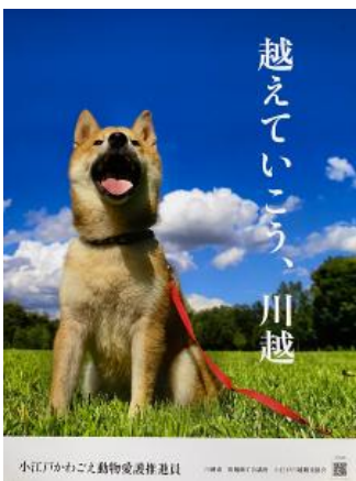
作成したポスター