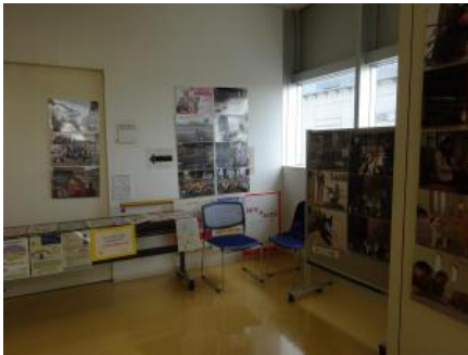
会場でのパネル展示1