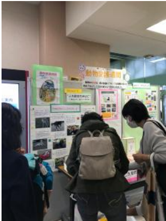
「動物愛護週間」の普及啓発のパネル展示1