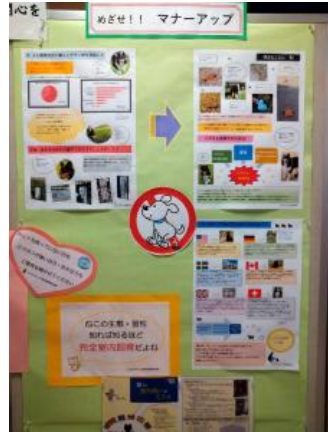
「動物愛護週間」の普及啓発のパネル展示2