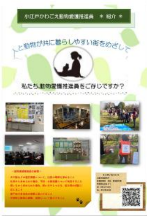
作成したポスター