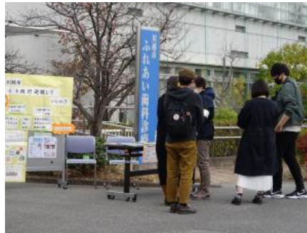
会場でのパネル展示2