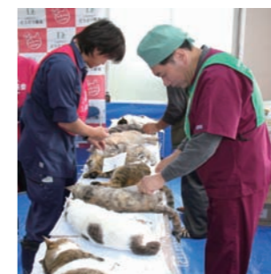
徳之島ごとさくらねこTNRプロジェクト