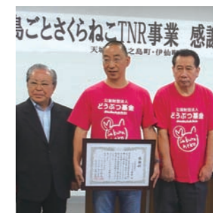
徳之島3町から感謝状贈呈