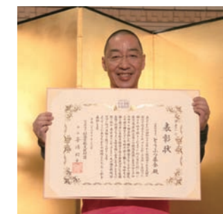
社会貢献支援財団より日本財団賞受賞