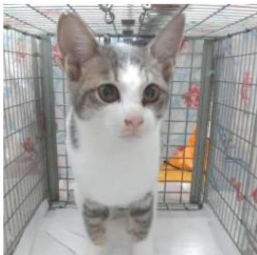
不妊去勢手術後の猫

(注) TNRが済んだ猫は、目印のために耳先V字カットを施します このTNR活動により不幸な猫が増えず、発情の鳴き声が無くなる等の効果が期待できます。