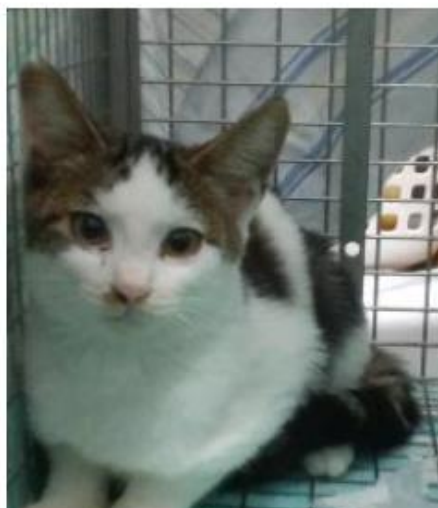
耳先がV字カットされています