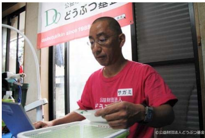
●スタッフは会場準備や獣医師のサポート