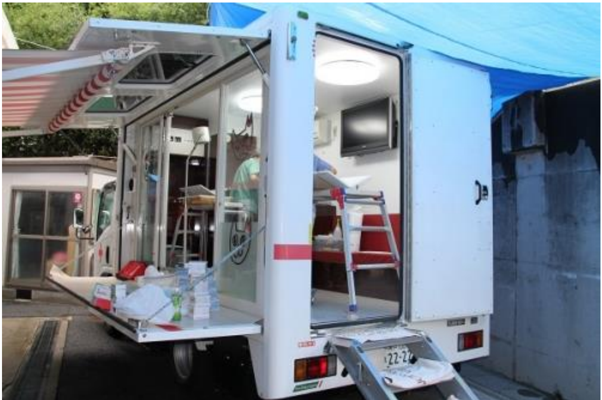
どうぶつ基金出張手術車