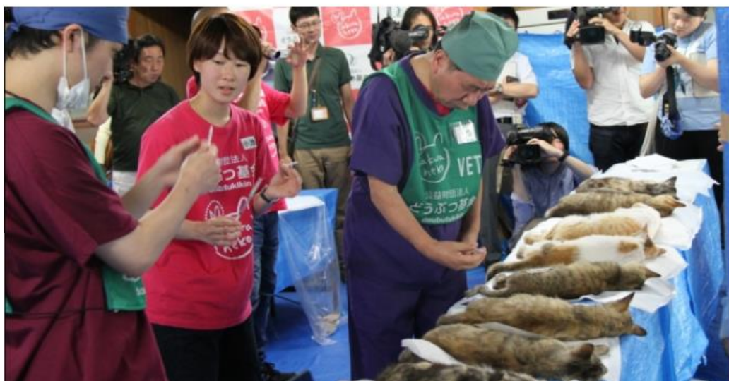
麻酔から醒めるまで待ってね

耳を切るなんてかわいそう、と思う人もいるかもしれませんが、不妊手術済みであるしるしをつけることで、手術済みのネコが再度開腹手術をされないように、守ってまいるのです。