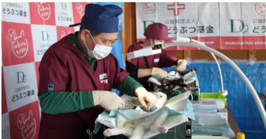
協力してくれる獣医師さんたちの真剣なまなざし。

つかまえて、不妊手術をして、もといた場所に放す、これをTNR（トラップ・ニューター・リターン）といいます。この手術を受けたネコは耳をV字にカットして「さくらねこ」になってもらい、「さくら耳は愛されネコのしるし」という合言葉もあるくらい、それぞれの地域でみんなに可愛がってもらっています。