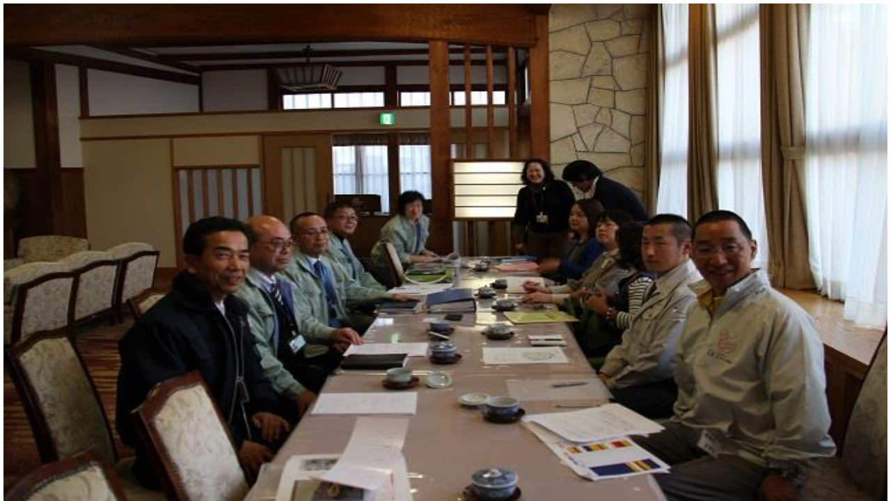
11月18日 打ち合わせ会議